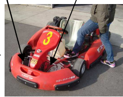
乗車します フレームは踏んでもOK