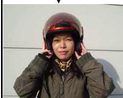
ヘルメットを装着