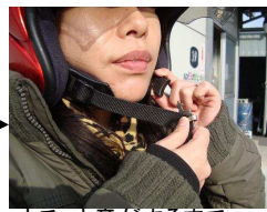
カチッと音がするまで差し込みます。