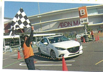
よくあるコースの例

「パイロン(マーカー)」で設定したコースを1台ずつ走って、ペナルティが最も少なかった人が優勝です。パイロンに接触したり、コースを間違えるとペナルティとなります。「運転の正確さ」を競うスポーツなので、特殊な運転技術より「ていねいさ」が大切です。